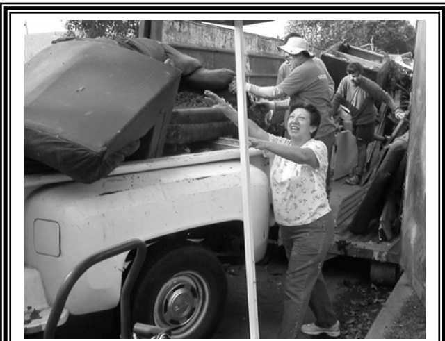
There was a lot to clean up in the alley between 8 th and 9 th streets in November, but it was worth it!

Khi Bạn sống ở khu vực lịch sử Craftsman, sẽ cần một giấy phép đặc biệt gọi là “Certificate of Appropriateness” của “Cơ Quan Bảo Tồn Lịch Sử” trước khi bắt đầu xây dựng hàng rào. Một giấy phép thành phố bình thường không đủ. Bạn phải gọi “Cơ Quan Bảo Tồn Lịch Sử” ở số điện thoại 562-570-6864 trước khi bắt đầu xây dựng. Theo khu vực lịch sử Craftsman, hàng rào gỗ tốt hơn hàng rào sắt. Sự quyết định hàng rào nào rất là quan trọng vì có thể ảnh hưởng giá trị của nhà của Bạn. Khi muốn bán nhà, hàng rào có tính cách Craftsman sẽ ảnh hưởng gia nhà.