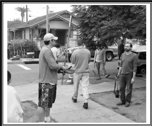
To celebrate our new trash cans on Orange we had a cleanup on December 6.