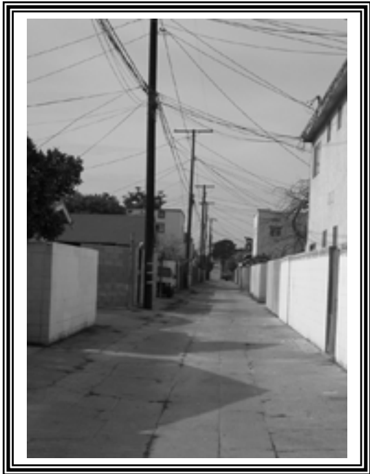
The alley between 8 th and 9 th streets after we cleaned it up.

បានមកបើកធ្វើហាងជំនួញមួយនៅពេលនោះ។ បន្ទាប់ ពីបានទទួលជោគជ័យខាងផ្នែកមុនរបរគាត់ក៏បានបង្កើតធ្វើធនាគារ Farmers and Merchants Bank ក្នុងឆ្នាំ ១៨៧១។ ក្នុងឆ្នាំ ១៨៨១ គាត់ក៏បានទិញដីនៅ Rancho Los Alamitos ក្នុងទីក្រុងឡងប៊ិចជាមួយនឹងក្រុមគ្រួសាររបស់លោក Bixby ។ The Rancho បានត្រូវចុះចែកសម្រាប់បុគ្គលនិមួយៗក្នុងចន្លោះឆ្នាំ ១៩១១ និង ១៩១៩ ក៏ពេលនោះហើយក៏ចាប់ផ្តើមចេញភូមិសម្រាប់អ្នកស្រុកត្រៀមមក។ ប្រជាជនដែលរស់នៅកាលពីឆ្នាំ ១៩២០ នៅក្នុងភូមិនោះមានមុខងាររាប់ បញ្ចូលទាំងអំពី សិល្បករ, ជាងផ្កាស្លឹក, អ្នករៀបតុបតែងលំអ, ជាងភ្លើង, អ្នកផ្ទៃកណៈនេយ្យ, អ្នកចាត់ចែងធ្វើការផ្សព្វផ្សាយ, អ្នកការខាងប៉ូស្តិស៍បុត្រ, អ្នកធ្វើការនៅតាមកាហ្វេ, អ្នកលក់សាច់, ជាងស៊ីម៉ង់ត៍, ជាងឈើ និងស្បែក។ ប្រជាជនទាំងនោះ បានសង់ផ្ទះជារៀបប្រណិត, គឺមានដូចជារៀប Victorian និងរៀបម៉ូឌររបស់ជនជាតិស្ប៉ានីស។ អ្វីទៅដែលហៅថា Craftsman Style? គឺជាសំណង់ដែលសាង ឡើងក្នុងចន្លោះឆ្នាំ ១៩០៥-១៩២០ ដែលយោងទៅតាមឧបករណ៍ដែលមានពីតម្លាជាតិ (ឈើ, ថ្ម) ហើយត្រង់លយទៅមុខ, គឺជារៀបម៉ូឌយ៉ាង ងាយបំផុត។ ផ្ទះទាំងនោះធ្វើឡើងដោយមានភ្លើង, ដំបូលទាប (ជួនកាលមានចំហសម្រាប់ខ្យល់) រាងហាលខាងមុខចំហដោយមានសសរឈើ, ថ្មបួតដួ ព័ទ្ធហើយនឹងមានឃាំងដោយរនាំងឈើ។ កិច្ចការទាំងនោះគឺធ្វើឡើងយ៉ាងងាយហើយស្រស់ស្អាតដោយចេញមកពីតម្លាជាតិ។