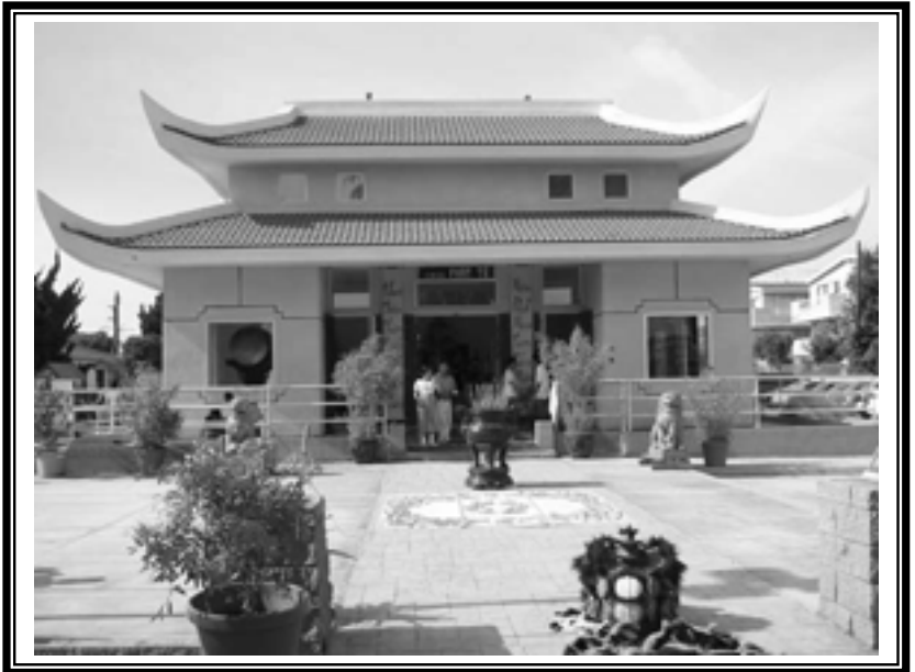
The Gotama Temple at 9 th and Orange is one of our landmarks. Its design fits in well with the Craftsman homes in the neighborhood, because of the interest in Asian design in the United States in the early twentieth century.

If you live in the Craftsman Village Historic District, you will need to get a special "Certificate of Appropriateness" from the Office of Historic Preservation before you begin. Normal city permits are not enough! You must call the Office of Historic Preservation at 562-570-6864 BEFORE you begin construction! Wrought iron fences should be avoided. Wood picket fences are preferred. In fact, choosing the right fence can significantly impact the value of your home: a historically appropriate fence boosts your home's sale price!