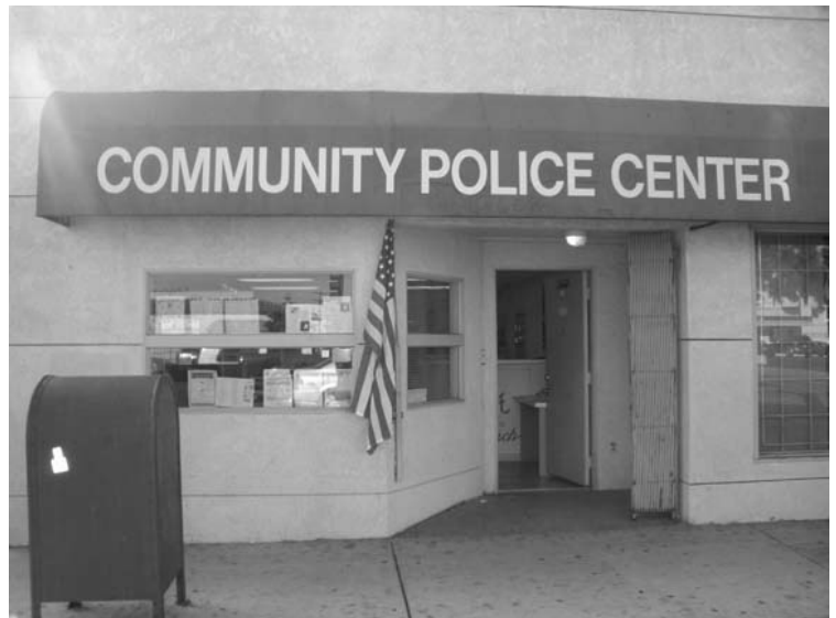
The Community Police Center (CPC) is at the intersection of 7 th Street and Alamitos.

Gonzalo emphasized that "anyone can feel comfortable coming to the CPC discuss any kind of problem with our retired police officer." There are staff at the CPC who speak Spanish and Khmai. If for any reason you don't feel comfortable calling the police to talk about a problem, or if you can't imagine going to a police station to file a report when you are the victim of a crime or know someone who has been a victim of a crime, thanks to the CPC you can talk about any concerns you have, knowing that you will be heard. The CPC can provide assistance with a wide variety of common problems such as gang activity, drug sales, excessive noise, property maintenance, rats, roaches, graffiti, restraining orders, arrests, traffic tickets, missing persons, parking, inoperable vehicles, trash, slumlords, and more. Remember: it's OUR Community Police Center, and it is there to serve our community. By using the CPC, we can fight crime in our historic district, making our neighborhood and all of Long Beach a better place for everyone!