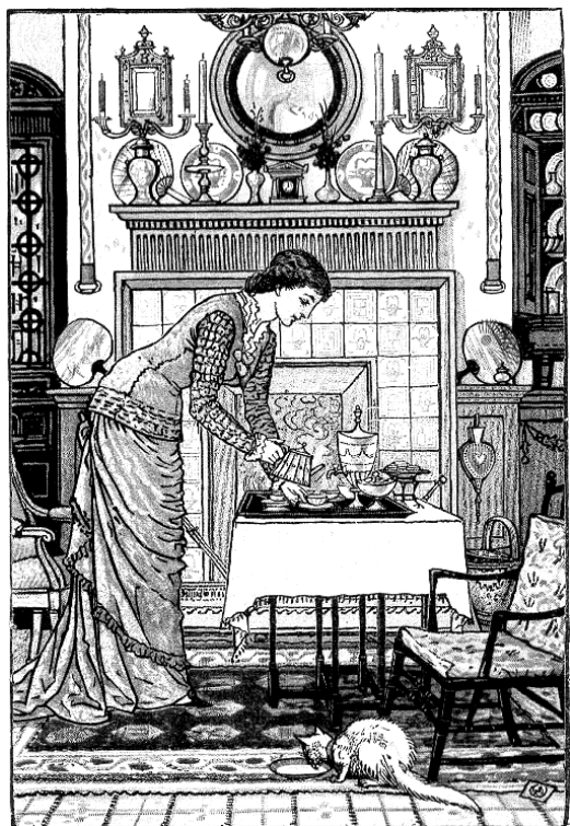
Tile was not used on the floors or porches of Craftsman homes, but it was used on kitchen counters and fireplaces.

” បង្ហាញធ្វើឲ្យអាមេរិកាំងក្លាំងក្លា។ ផ្ទះតូចៗទាំងឡាយនេះមានតម្លៃបន្តិចបន្តួច ប្រមាណជា ៩០០ដុល្លារ ដែលជា ករណីធ្វើឲ្យអាមេរិកាំងអាចជួបនូវសេចក្តីស្រឡាច់ចិត្តរបស់គេ ដើម្បីមានផ្ទះនៅផ្ទាល់ខ្លួន ហើយមានប្រដាប់នៅក្នុង សំណង់នោះគ្រប់គ្រាន់។ នៅផ្នែកកណ្តាលរបស់ផ្ទះភាគច្រើនគេធ្វើឡើងជារៀបរយជាទីបំផុត ហើយសិប្បកម្ម អាចរកឃើញមានចំពោះកន្លែងដែលមានបញ្ជាក់នូវភាពរុងរឿង។ បង្ហាញដែលកម្រនឹងមានគឺភាគច្រើនសាងឡើង ដែលជារបស់អ្នកមាន។ បង្ហាញជានិមិត្តដ៏ទៀងត្រង់ដែលកើតមានលើគំនិតដ៏យូរយារៈ លើការការពារព្រះ។ បង្ហាញ ជានិមិត្តមិនមែនគ្រាន់តែជាលំនៅស្ថាននោះទេ។ គឺជានិមិត្តនៃសេចក្តីស្រឡាច់ចិត្តរបស់ជនជាតិអាមេរិកាំង។