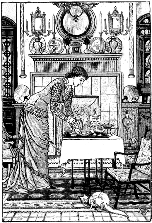
Tile was not used on the floors or porches of Craftsman homes, but it was used on kitchen counters and fireplaces.

” បង្ហាញធ្វើឲ្យអាមេរិកាំងក្លាំងក្លា។ ផ្ទះតូចៗទាំងឡាយនេះមានតម្លៃបន្តិចបន្តួច ប្រមាណជា ៩០០ដុល្លារ ដែលជា ករណីយធ្វើឲ្យអាមេរិកាំងអាចជួបនូវសេចក្តីស្រមៃរបស់គេ ដើម្បីមានផ្ទះនៅផ្ទាល់ខ្លួន ហើយមានប្រដាប់នៅក្នុង សំណង់នោះគ្រប់គ្រាន់។ នៅផ្នែកកណ្តាលរបស់ផ្ទះភាគច្រើនគេធ្វើឡើងជារៀបរយជាទីបំផុត ហើយសិប្បកម្ម អាចរកឃើញមានចំពោះកន្លែងដែលមានបញ្ជាក់នូវភាពរុងរឿង។ បង្ហាញដែលកម្រនឹងមានគឺភាគច្រើនសាងឡើង ដែលជារបស់អ្នកមាន។ បង្ហាញជានិមិត្តដ៏ទៀងត្រង់ដែលកើតមានលើគំនិតដ៏យូរយារៈ លើការការពារព្រះ។ បង្ហាញ ជានិមិត្តមិនមែនគ្រាន់តែជាលំនៅស្ថាននោះទេ។ គឺជានិមិត្តនៃសេចក្តីស្រមៃរបស់ជនជាតិអាមេរិកាំង។