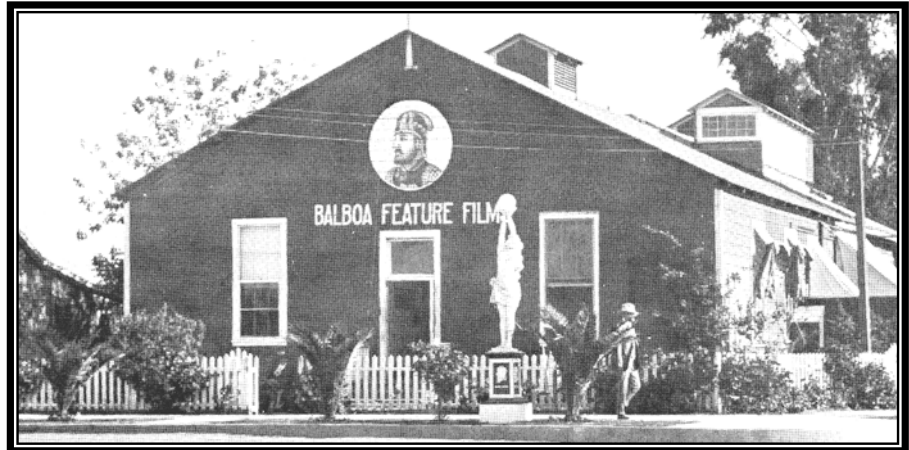
An old photograph of Balboa Studios (7 th & Alamos)

If you have never been to MoLAA, visit the museum and see their amazing collection of art! Thanks to the support of people like Gregorio Luke, MoLAA will help our neighborhood continue to improve into the future.