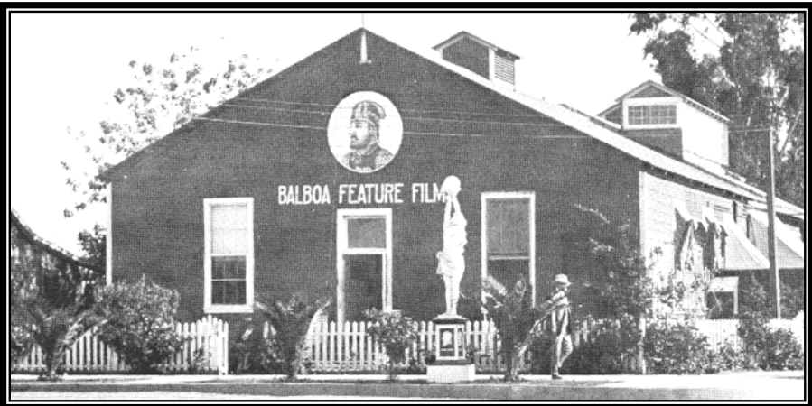
An old photograph of Balboa Studios (7 th & Alamos)

ប្លុកនៃតំបន់ប្រវត្តិសាស្ត្ររបស់យើង។ ទោះបីជាអ្នកមិនដែលបានទៅកន្លែងនោះក៏ដោយ, លោកអ្នកអាចឃើញបាននៅតាមកន្លែងដែលគេកំពុងសាងសង់នៅចន្លោះផ្លូវលេខ ៦ និង អាឡាមីតូស ដែលគេកំពុងតែធ្វើកិច្ចការសង់ពង្រីកបន្ថែម។ សារមន្ទីរនេះ